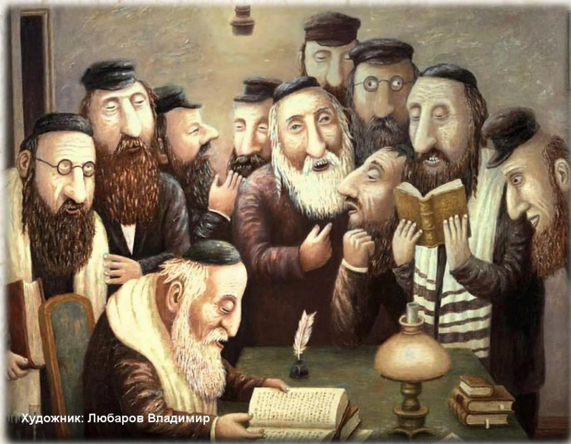
Художник: Любаров Владимир