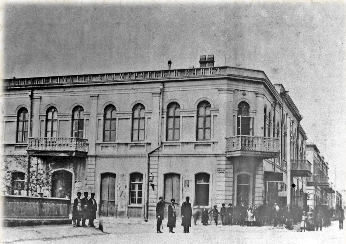
В нескольких помещениях этого дома по ул. Церковная 195 (Видади), угол Красноводской (С. Вургуна), на втором этаже, располагалась хасидская синагога до середины марта 1923 г.