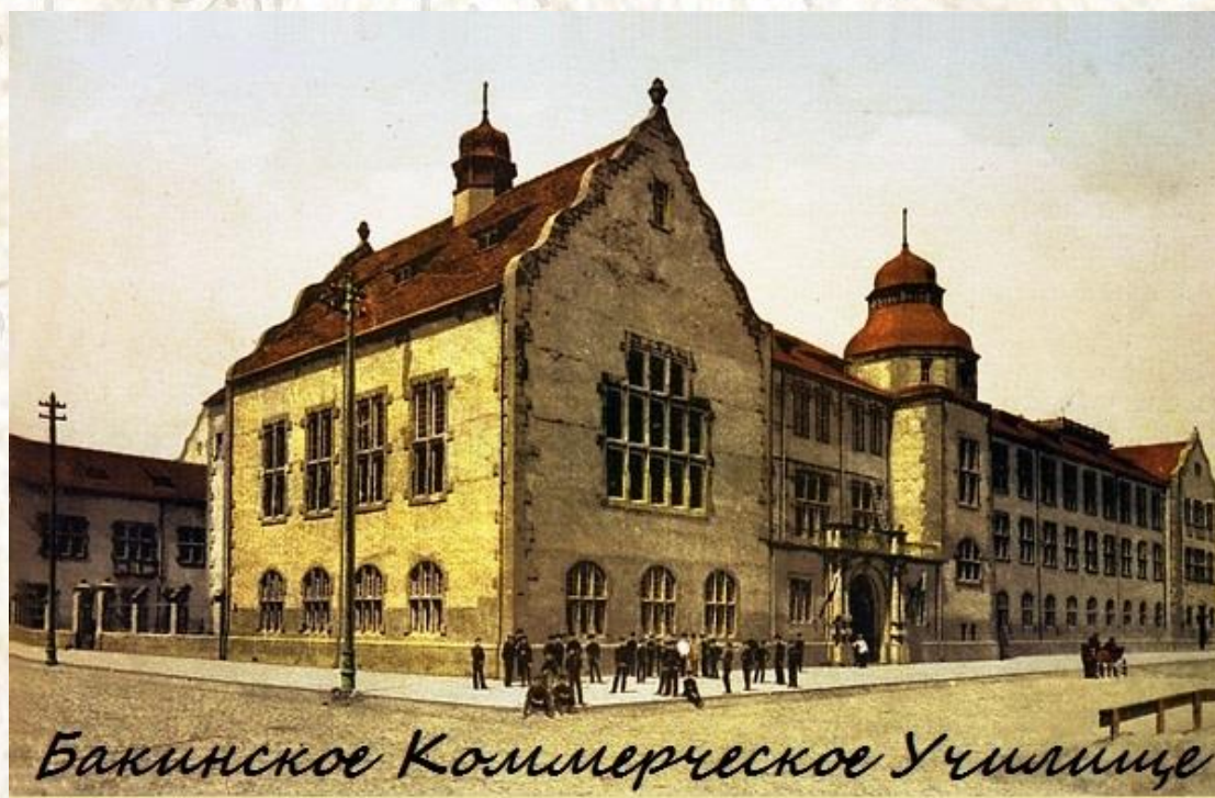
Здание Бакинского Коммерческого училища

Первое публичное заседание Б.Е.Н.С. прошло в субботу, 16 декабря 1917 г, в зале коммерческого училища 20 .